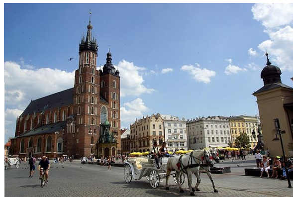
Kraków - Stare Miasto

Rynek Główny i sieć tworzących Stare Miasto ulic wytyczone zostały w roku 1257 podczas lokacji miasta na prawie magdeburskim. Do dziś przetrwały usytuowane centralnie na Rynku Sukiennice (dawniej i współcześnie miejsce handlu, a od ponad stu lat najpierw główna siedziba, a potem jeden z oddziałów Muzeum Narodowego w Krakowie), mały kościółek św. Wojciecha (miejsce ważnych odkryć archeologicznych), samotna wieża wyburzonego w XIX w. ratusza i oczywiście jeden z symboli Krakowa – kościół Mariacki – z wyrastającymi ponad miasto strzelistymi wieżami. Tutaj dzieło swego życia – monumentalny ołtarz przyciągający codziennie tysiące turystów – stworzył norymberski mistrz Wit Stwosz. Z Rynkiem wiąże się część krakowskich legend i tradycji oraz wiele wydarzeń historycznych. Do nich nawiązuje np. hejnał grany co godzinę z jednej z wież mariackich, czerwcowy pochód Lajkonika, intronizacja Króla Kurkowego czy grudniowy konkurs szopek.